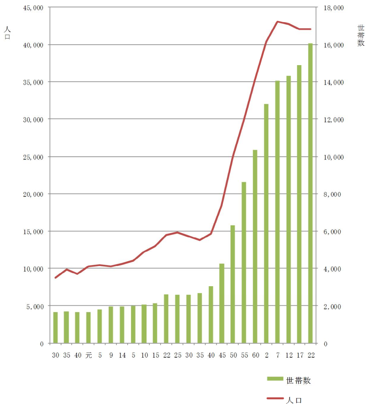
第1図 過去の人口と世帯の推移（第1表から）