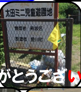
太田ミニ児童遊園地