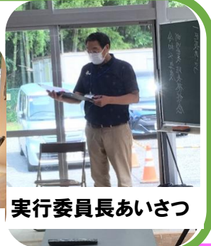
実行委員長あいさつ