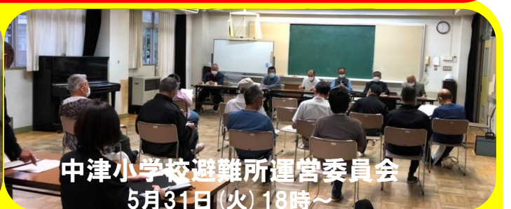
中津小学校避難所運営委員会 5月31日(火) 18時～