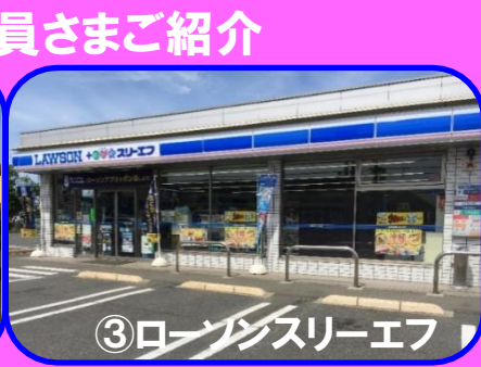
③ローソンスリーエフ