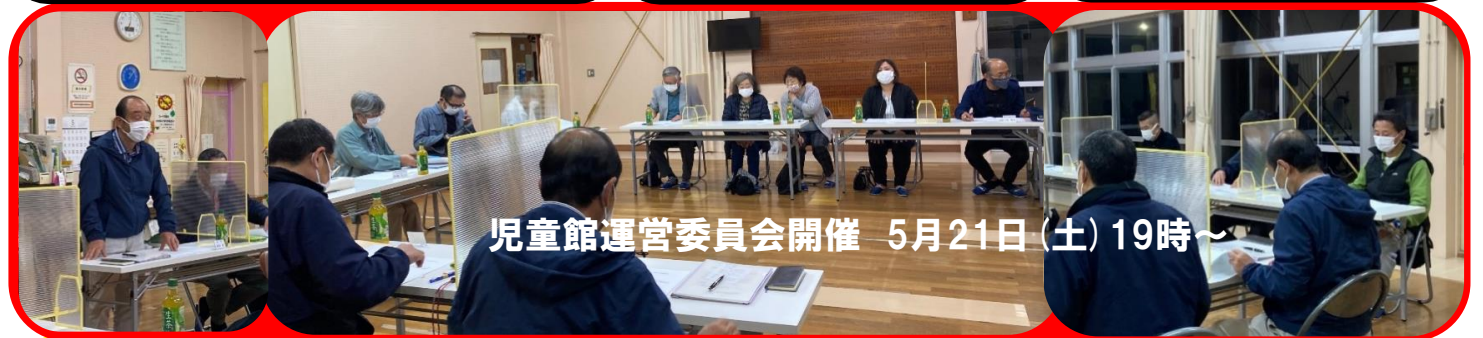
児童館運営委員会開催 5月21日(土) 19時～