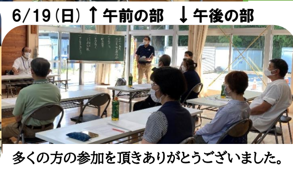
多くの方の参加を頂きありがとうございました。