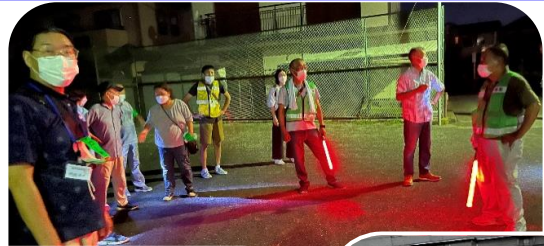
中津小学校集合者

8月18日町内9ヵ所の集合場所に約180名が集合 各コース：19時パトロール開始、20時頃終了