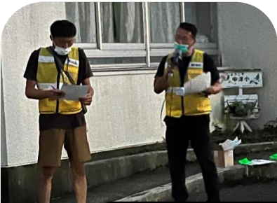
青少年指導員の説明を受けパトロール開始