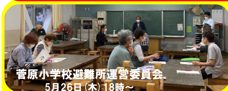
菅原小学校避難所運営委員会 5月26日(木) 18時～