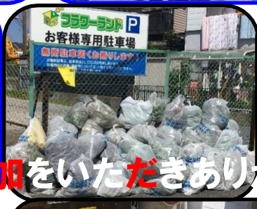
お客様専用駐車場