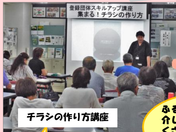
千ラシの作り方講座

サポセンでは、登録団体向けに、活動発表会、交流会、スキルアップ講座などを企画・開催しています。