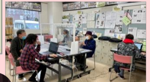
パソコン相談室の様子