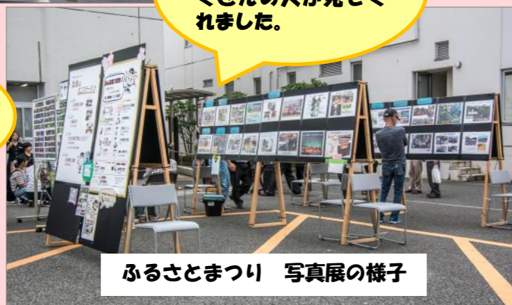
ふるさとまつり 写真展の様子