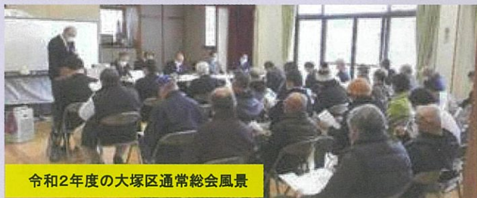
令和2年度の大塚区通常総会風景

3月に入りましたら総会資料(要約版)を配布させて頂き、書面表決する予定です。何卒ご理解のほど宜しくお願い致します。