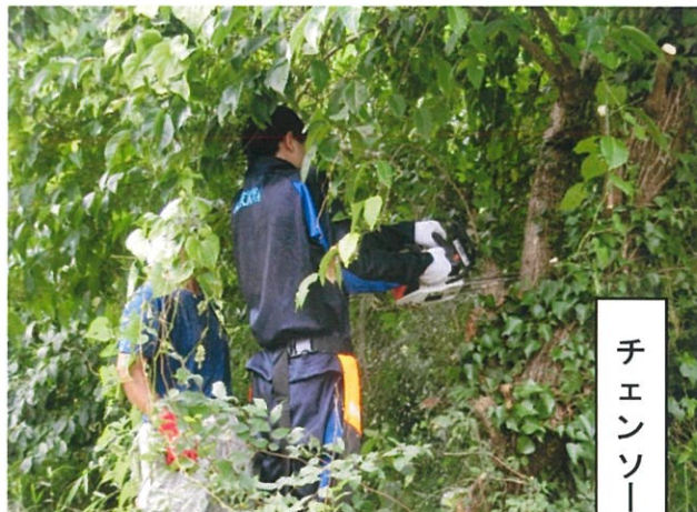
チェーンソー体験