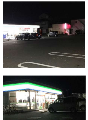
12/25相模検査事務所広場