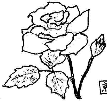
京 女王様のようなバラが あちこちで咲きほこっています

福寿草の会 愛川町介護者の会 第163号 2021年5月7日 連絡先 愛川町社会福祉協議会 Tel 046 (285) 2111