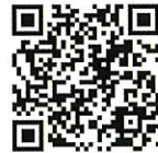
練習風景動画とグラウンドへの地図