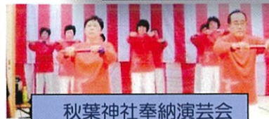
秋葉神社奉納演芸会