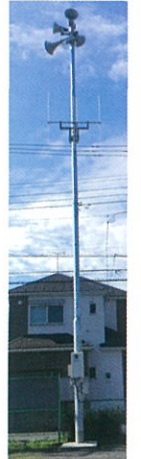
児童館に移設防災無線