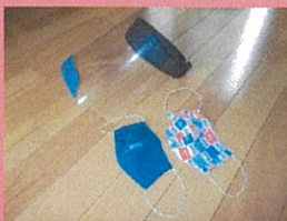
自作の布マスクと 可動式フェイスシールド

令和元年度桜台区自治会通常総会の書面決議から始まり春レク、盆踊り大会等のイベントの中止。この間運営委員会も半分の人数にて開催し、コロナ禍の中、新しい日常への取り組みを話し合ってきました。3密、ソーシャルディスタンス、withコロナ等、初めて耳にした言葉に苦悩していましたが、早く新しい日常に