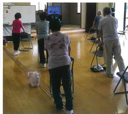
足首に重りをつけて