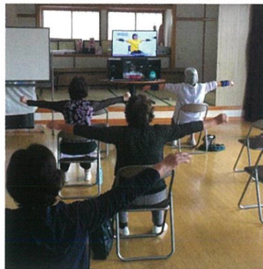
手首に重りをつけて