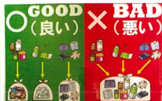
注意喚起ポスター