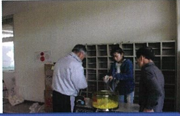
ポップコーンを袋詰め

11月9日（土）8時30分から中津第二小学校を会場に第22回ふれあいレクリエーションが開催されました。スカットボール、MINI運動会、とびだすクリスマスカード作りなどが行われ、大塚自治会役員もボランティアの小学生と一緒にポップコーンを400袋作り参加者に配布いたしました。