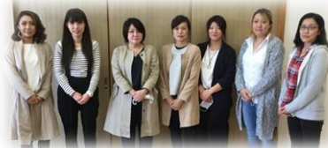
本年度子供部会の役員の皆様