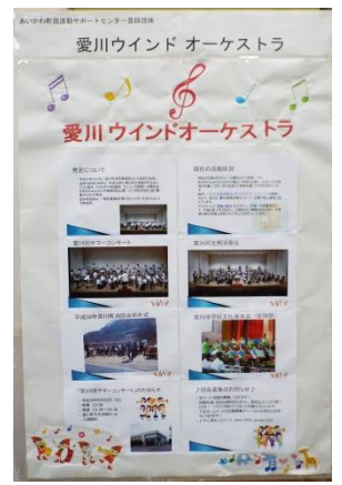
愛川ウインド オーケストラ