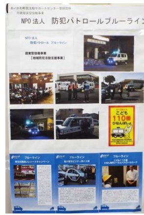
NPO 法人 防犯パトロール ブルーライン