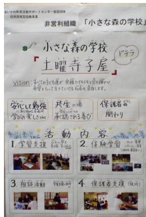
非営利組織「小さな森の学校」 『土曜寺子屋』