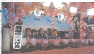
八雲祭（子供お囃子）