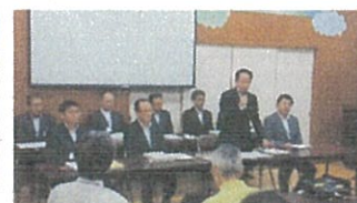
ファミリアミーティング