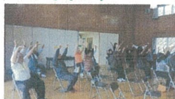
町職員及び健康推進委員と高砂会の皆さん