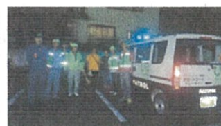
総合防犯パトロール（青パト参加）