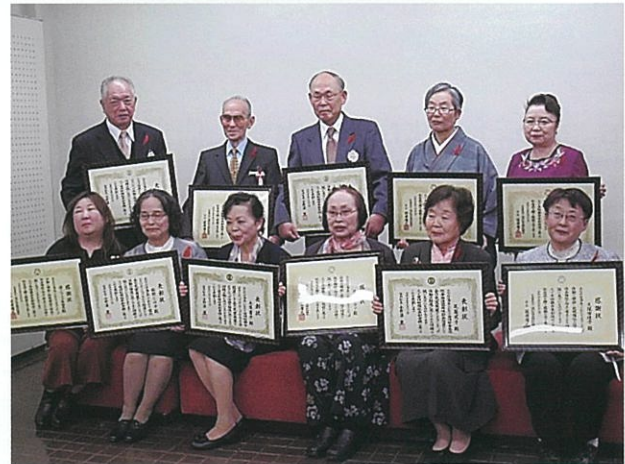
愛川町社会福祉大会 受賞者 福祉功労表彰・善行者感謝