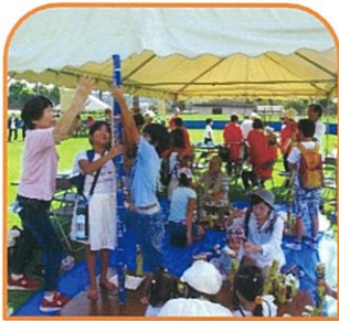
背たけより高く 缶積みゲーム