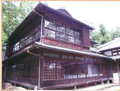
三井八郎右衛門邸