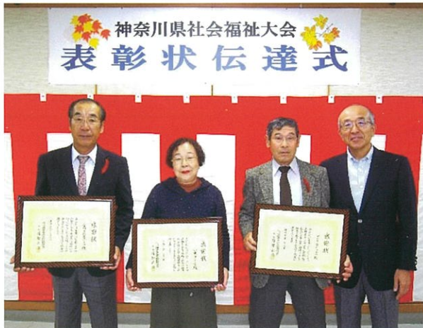
神奈川県社会福祉大会 受賞者 神奈川県社会福祉協議会会長感謝