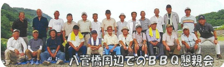
八菅橋周辺でのBBQ懇親会