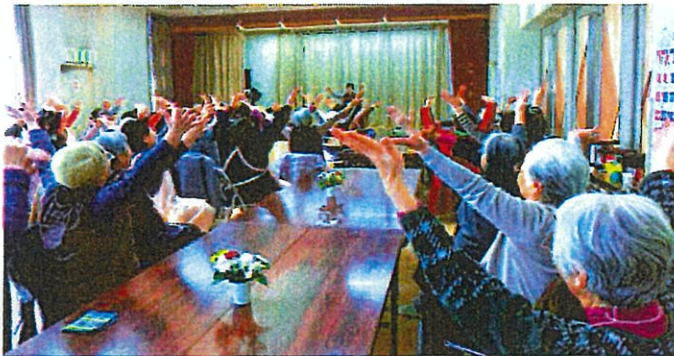
平成29年度「ふれあい会」ボランティア名簿

平成10年2月に自治会の支援で発足した「ふれあい会」も20年になります。お隣さんの声掛けに始まり、お友達ができ、楽しいお話し合いが始まります。春日台自治会に感謝しております。愛川町の保健師さんによる血圧測定や、「健康相談」や「手先の運動」「頭の体操」「グループ活動」「ケーキ作り」など実施します。年間の行事では「バス旅行」や「健康相談」「一粒の交流会」など楽しく参加しています。特に年末の「クリスマス会」が楽しみです。民生児童委員の皆さんは、「ふれあい会」に加入して、利用者の意見や希望を聞き、地域の福祉支援にご指導を頂きます。更に一人暮らしの皆さんを見守り、交流会の参加には送迎サービスをやります。今後とも地域の支援を宜しくお願いいたします。