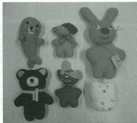
アニマルストラップやおちゃん子人形、ベビータオル等かわいくて欲しくなるような作品を作っています。今年十一月、来年二月の毎週火曜日には販売員を担当します。平塚市役所に出掛ける機会がありましたら是非、声を掛けて下さい。

○販売日時 開庁日（平日）の午前十時～午後三時 ○実施場所 平塚市役所本館一階東側多目的スペース内でのワンゴ販売 当協会会員が心を込めて製作した作品の一例です。