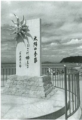
【太陽の季節 記念碑】

海は様々な様相を呈する耀く顔がたくさん。秋の海・冬の海・春の海、昼と夜に輝きが変わり、「荒天の海、風」。雨の日の海を、耀きを知る人は、意外に少ないのかもしれません。しかし、疲れた心と身体を解放したいときには「逗子の海へ行こう！」 何が待っているかは「あなたの笑顔」しだい。