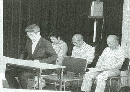
祝辞を述べられた来賓の大貫民生部長、若井県代表、伊勢原支部蛸崎、医療生協渡辺の方々。