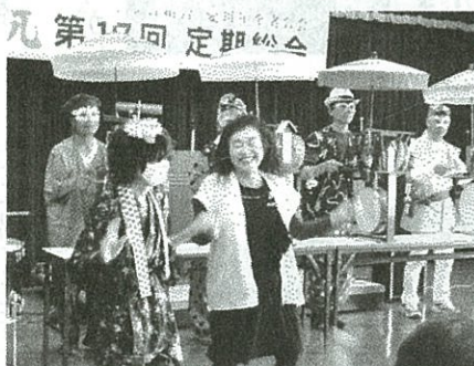
思わず飛び入りした参加者

熊本地震カンパ 2万2千円集まる 第17回総会の席上、呼びかけた熊本地震のカンパは2万2千円集まりました。ご協力ありがとうございました。 また、めだかの学校から、愛川年金者の会に5千円の寄付がありました。