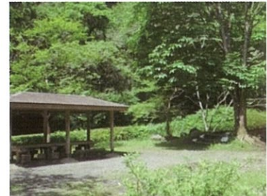
いこいの森の東屋