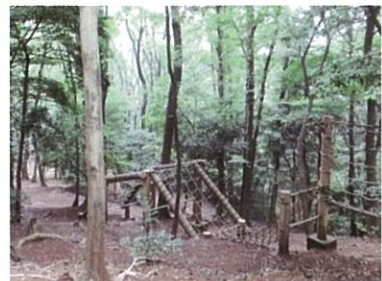
フィールドアスレチック