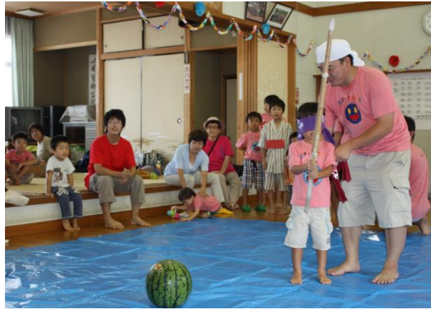
☆毎年8月には手作りの夏祭りを企画・開催しています