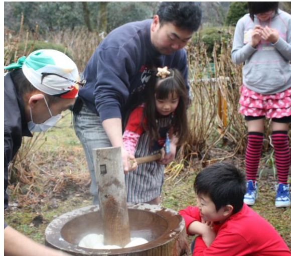
☆毎年3月には餅つきを企画・開催しています