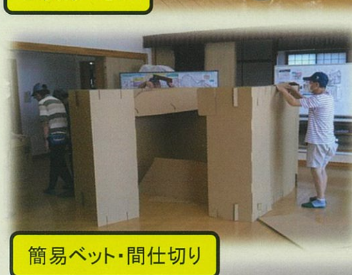
簡易ベット・間仕切り