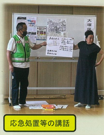
応急処置等の講話