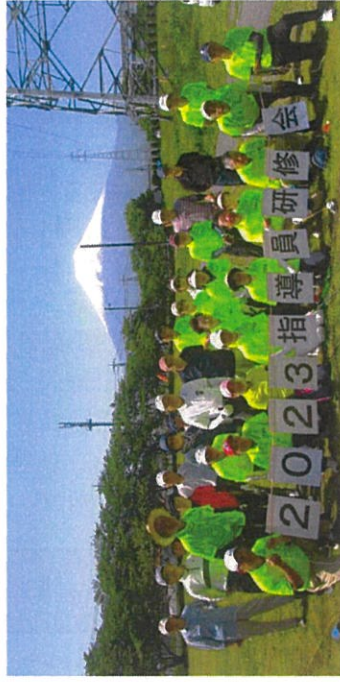
[2023年5月17日 指導員研修会 富士吉田市]

やっとコロナも収まり、昨年は、晴天に恵まれ参加者三十名で実施する事が出来ました。今年の研修先は山梨県富士吉田市美富士ターゲット・バードゴルフ場、18ホールで富士山が目の前に見える場所でした。名物コースは富士山が描かれている看板を1打目で越す事が出来るか刻むかプレッシャーの掛かるホールでした。