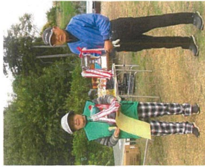
[町長杯男女の優勝者]

前日までの暖かさは嘘のように、一転して今日は冬本番の寒さ。自己ベストの62を切る事を目標として頑張ったが及ばず結果は67でした。これからも日々精進し、ベストスコアを出せるように努力します。