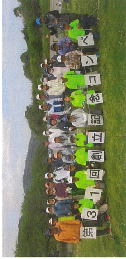
[2023年4月25日 創立記念コンペ 坂本さくらコース]

また、私たちは協会活動以外にも積極的に参加しています。各大会で我が協会の会員が上位入賞し、他協会からも注目される存在となっています。