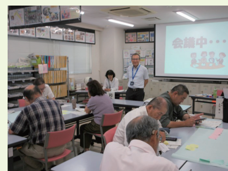
2部。模擬会議中、皆さん真剣です。