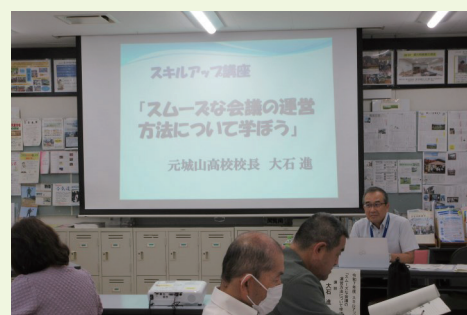
1部の様子。まずは会議の基本。