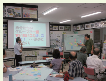
実りある会議の結果を発表。