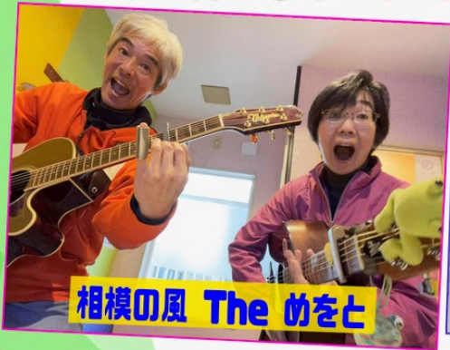
相模の風 The めをと