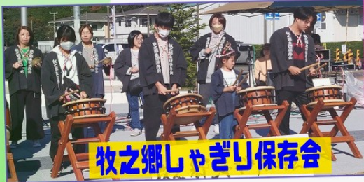
牧之郷しゃぎり保存会