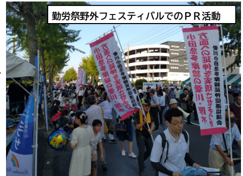
勤労祭野外フェスティバルでのPR活動

当協議会の取組みや小田急多摩線の延伸構想を広く周知し、機運醸成を図るため、令和7年度に行われた「勤労祭野外フェスティバル」や「ふるさとまつり」でPR活動を実施しました。今後も引き続き、お子さんから大人まで多くの方に興味を持ってもらえるよう取組みを進めてまいります。