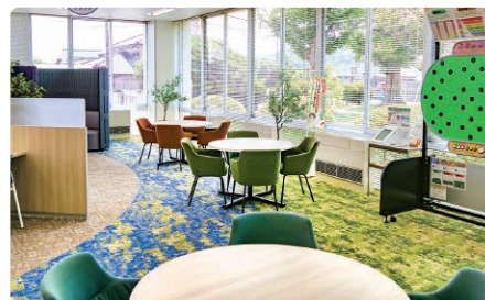
役場庁舎1階 高齢介護課フロアにある「ふれあいラウンジ」