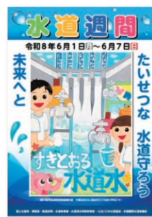
第68回水道週間ポスター

問 水道事業所 業務班 ☎(内線)3487 「たいせつな 水道守ろう 未来へと」 6月1日～7日は水道週間です