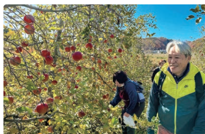
リンゴ狩りを楽しむ参加者

11月29日、立科町交流バスツアーを開催し、子どもから高齢者までの57人が、立科町特産の「ふじ」のリンゴ狩りなど立科町の魅力を満喫しました。参加した皆さんは「また来年も来たいです」と満足げに話していました。皆さんもぜひ一度、友好都市・立科町を訪れてみてはいかがでしょうか。