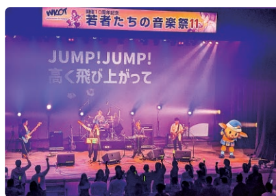
テーマソング「私たちの音楽祭」の演奏