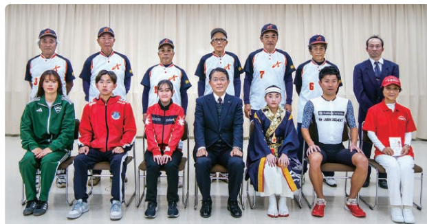
交付式後の記念撮影