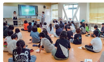
ユニクロ社員によるSDGsやリサイクルについての出張授業