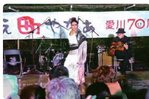
フラメンコダンスショー