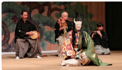
能の鑑賞「経正」の上演