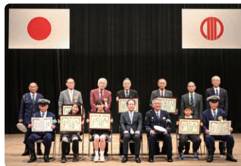
表彰された方々の記念写真