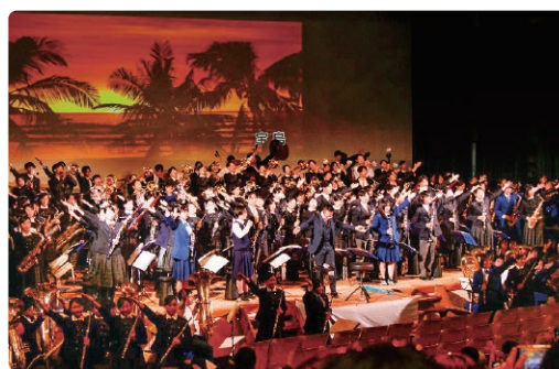
町立中学校吹奏楽部との交流演奏

公演のラストには、町立中学校吹奏楽部との交流演奏として人気曲『宝島』を演奏。観客は「最高の感動とエネルギーをもらった」と感激の様子で、町の文化的な秋を彩る、記憶に残る一日となりました。