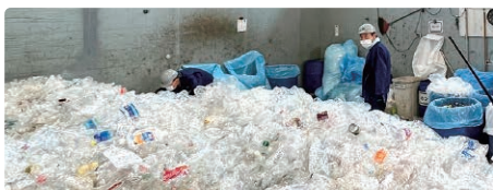
町内で集められた使用済みペットボトル

町内の家庭から出る使用済みペットボトルの排出量は年間約180トン。これは、500ミリリットルのペットボトル約900万本分に相当し、町民1人当たり年間で230本になります。これらのペットボトルを正しく分別することで、全てが新しいペットボトルに生まれ変わります。