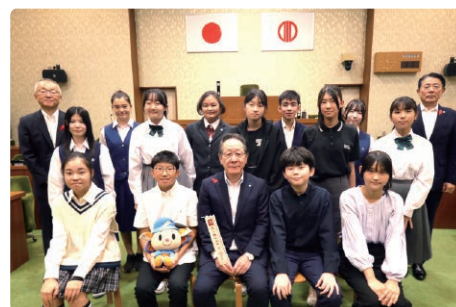
子ども議員の皆さんの記念撮影

今回は「住み続けたい愛川町にするために～夢を語ろう～」をテーマに、小学6年生から高校1年生までの13人が登壇。公共施設へのエアコン設置や鉄道延伸、環境美化、イベント開催など、多彩な提案を行いました。