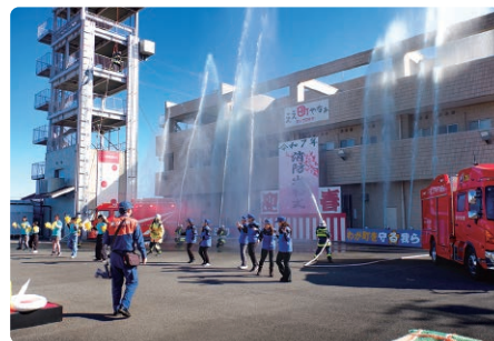
令和7年の一斉放水の様子