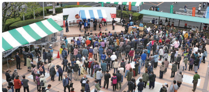
町政70周年記念大抽選会の様子

会場では、全国各地の地域物産や愛川ブランドなどの模擬店が多数出店したほか、宮城県石巻市雄勝町伊達の黒船太鼓や阿波おどり、歌謡ショー、フィナーレの町政70周年記念大抽選会也大いに盛り上がり、節目の年にふさわしい、にぎやかな一日となりました。