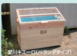
愛川キエーロ(ベランダタイプ)