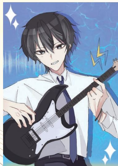
イラスト 片野由梨花(Arcus)