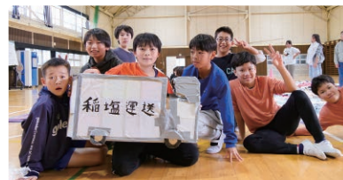
手作りの回収ボックスなど、工夫を凝らして、衣服回収の協力を募りました。