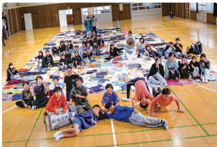
集まった衣服を体育館に広げて記念撮影

中津第二小学校は、ユニクロ(株式会社ファーストリテイリング)の「届けよう、服のチカラ」プロジェクトに参加しています。着なくなった衣服を難民キャンプなどに届ける活動を学んだ6年生たちが活動を開始し、回収ボックスの作成や校内放送で回収の呼び掛けを行ったところ、たくさんの衣服が集まりました。集まった衣服を体育館一面に広げ、下着や小物など送れない物をチェックし、種類ごとに段ボールに詰めました。これらの衣服はユニクロのプロジェクトを通じて世界の難民キャンプなどに届けられます。