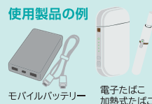
モバイルバッテリー 電子タバコ加熱式タバコ

充電電池単体(ビニールテープで絶縁処理をする)または充電電池を取り外せない製品をビニール袋に入れて資源Aの収集日に、指定のゴミ集積所へ出してください。50センチメートル超の製品は粗大ごみとなります。「使用済み小型充電式電池のリサイクル(回収)」