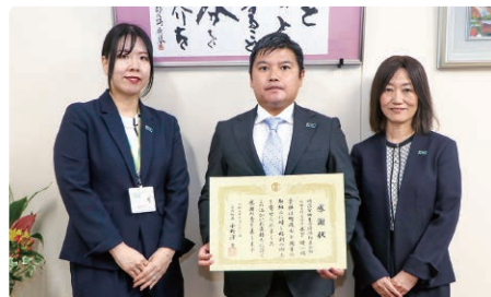
左から明治安田生命保険 本厚木営業部 花上LC、 小川営業部長、志村総務課長。