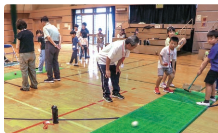
スカットボールを楽しむ参加者の皆さん

参加した小学生は「スカットボールは初めてだったけれど、5点の穴に入れた。うまくできて良かった」とうれしそうに話しました。