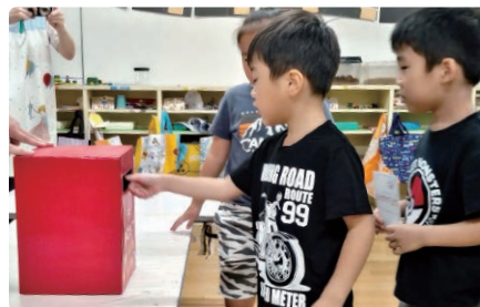
手作りポストに投函する園児たち

9月4日の高峰保育園を始めとして、各保育園の園児たちがポストカードに家族の似顔絵やメッセージを書き、手作りポストに投函。今年は町政70周年記念としてオリジナルのポストカードを使用し、記念のオリジナル小型印による消印を押印してそれぞれの自宅へ郵送されました。