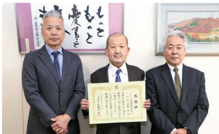
左から愛川町建設業協会 高麗副会長、鈴木会長、 星副会長