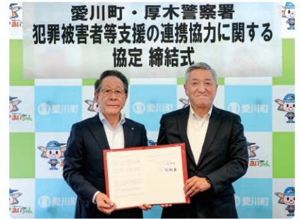
小野澤町長と阿部署長