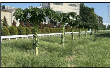
パパイヤロード（中津）

農業委員会は、有害鳥獣被害対策として効果があると言われている青パパイヤの研究を昨年度から行っています。 今年度は、町道路課と協働で管理を行っている中津の第2号公園となりの「パパイヤロード」と、半原の研究圃場で作付を行いました。霜に弱いため冬を越せずに枯れてしまいましたが、秋には実を収穫できます。 まだまだ生育の研究中ですが、ほとんどの苗が実をつけていますので、本町でも問題なく育つことが確認できました。 今後は、実や葉の効果的な活用方法について、研究を進めていきたいと考えています。また、種からの栽培も始めたので、来年は愛川町産の青パパイヤの出荷に期待したいです。