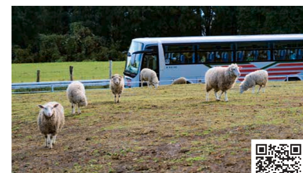
たとえば、この服部牧場 羊たちが観光バスから降りてきたっぽい 放牧の様子が、エモすぎてやばいかと。