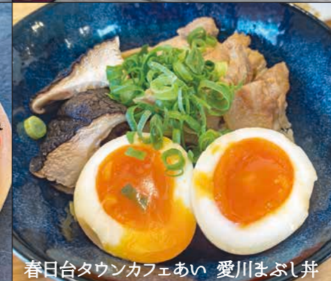
春日台タウンカフェあい 愛川まぶし丼

愛川ブランド認定品はここで紹介した製品のほかにもあります。詳しくは、上記二次元コードからご確認ください。