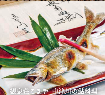
観泉荘こまや 中津川の鮎料理