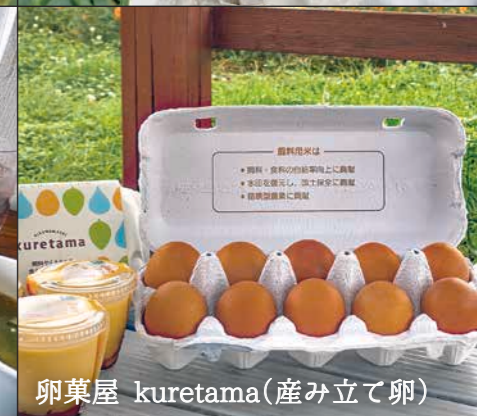
卵菓屋 kuretama (産み立て卵)