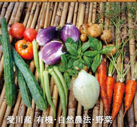
愛川産 有機・自然農法・野菜