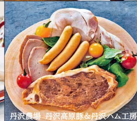
丹沢農場 丹沢高原豚&丹沢ハム工房