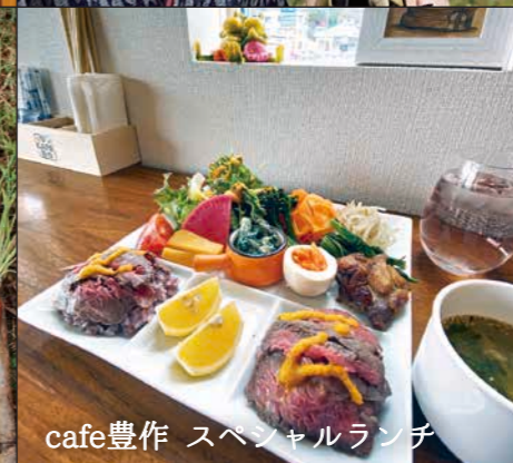
cafe豊作 スペシャルランチ