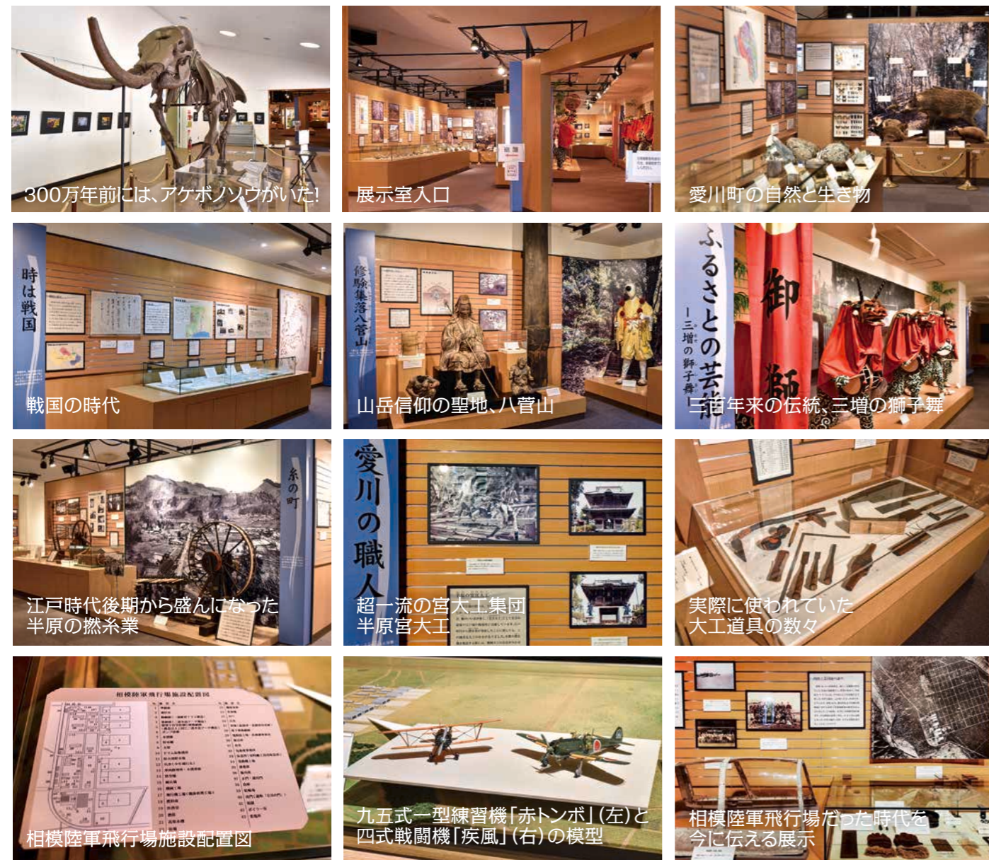
300万年前には、アケボノソウがいた!