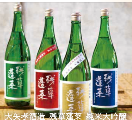
大矢孝酒造 残草蓬菜 純米大吟醸