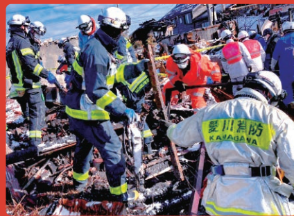
現地で支援活動を行う本町の消防職員

町では、1月1日に発生した令和6年能登半島地震で被災された方々への義援金を受け付けています。お寄せいただいた義援金は、日本赤十字社神奈川支部を通じて、被災された皆さんへお届けします。