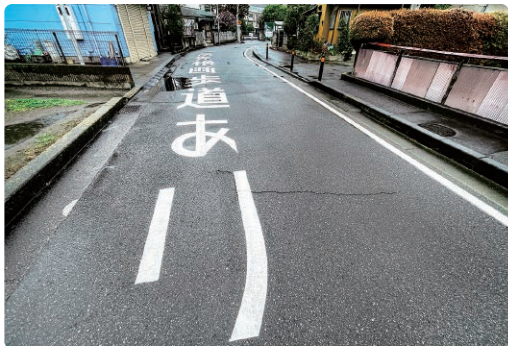
町道田代215号線 区画線設置工事 (田代小学校付近)

道路交通の安全性向上のため町道7箇所の区画線設置工事および交差点2箇所のカラー舗装工事を実施しました。