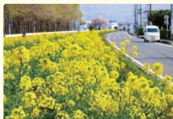
菜の花が広がった昨年のフラワーロード