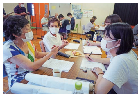
話者の話を熱心に聞く学生