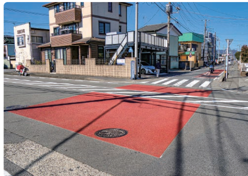
町道中津114号線 カラー舗装工事 (レディースプラザ 付近)