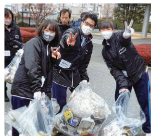
拾ったごみを持ってポーズを決める参加チーム。

2月17日、制限時間内に工業団地内エリアの歩道・グリーンベルトのごみを拾い、その量と質でポイントを競い合う「スポGOMI in 神奈川県内陸工業団地」が開催。当日は18チーム、54の方が参加され、合計で約40キログラムのごみが集められました。