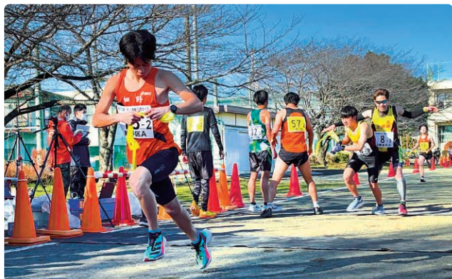
第1中継所(高峰小学校)でのたすきリレー

1月7日、新春恒例の「第69回愛川町一周駅伝競走大会」を開催し、第1部には各行政区から、第2部には友好都市・長野県立科町や企業、高校など総勢34チームが参加し熱戦を繰り広げました。第1部では細野区Aチームが、第2部では立科町チームがトップでゴールし、7連覇を果たしました。選手たちの力走は新年の幕開けに色を添え、町に元気と活力を与えてくれました。