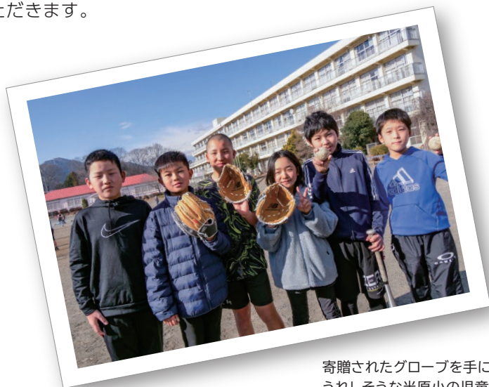
寄贈されたグローブを手 うれしそうな半原小の児童

メジャーリーガーの大谷翔平選手から各小学校に、「野球しようぜ」と書かれた手紙とともにサイン入りグローブ3つが寄贈されました。グローブは、大谷選手の思いに応えられるよう、大切に使用させていただきます。