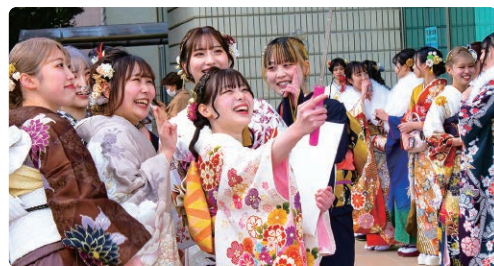
出席された皆さん

1月7日、文化会館で「令和6年愛川町二十歳のつどい」を開催。20歳を迎えられた方々が久しぶりに再会した友人との会話に花を咲かせました。今年は4年ぶりに町内3中学校合同で式典を行い、小・中学校時代の恩師からのビデオレターが放映されると、会場は笑顔にあふれました。