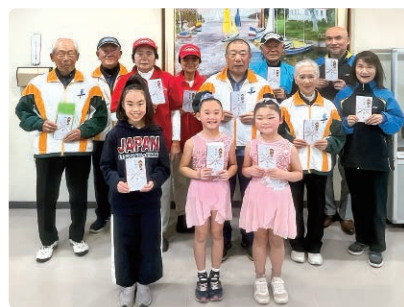
交付式後の記念撮影