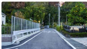
拡幅工事を実施した道路

良好な住環境を整備するため、中津地区にある六倉坂の道幅が狭い区間の道路拡幅工事を行いました。