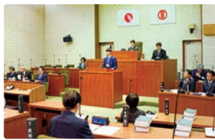
子ども議会の様子