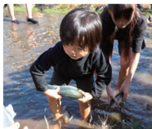
夢中でマスを捕まえる子どもたち