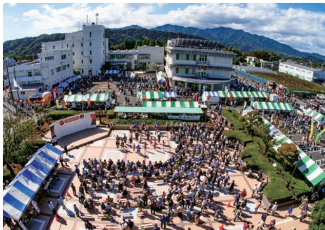
多くの来場者でにぎわう会場

10月22日、町の産業・文化などを広く内外に紹介する「ふるさとまつり」を役場周辺で開催し、家族連れなど約3万人を超える来場者で賑わいました。