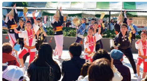
東京高円寺阿波おどり振興協会

当日は、ステージイベントや文化芸能発表のほか、恒例の友好都市・立科町のリンゴをはじめ、長野県山ノ内町のシャインマスカット、愛媛県宇和島市の「極早生みかん」、群馬県の「峠の釜めし」、さらには新たに、福島県の特産品販売を行うなど、さまざまな催しにより、ご好評をいただきました。