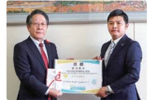
小野澤町長と小川本厚木営業所長