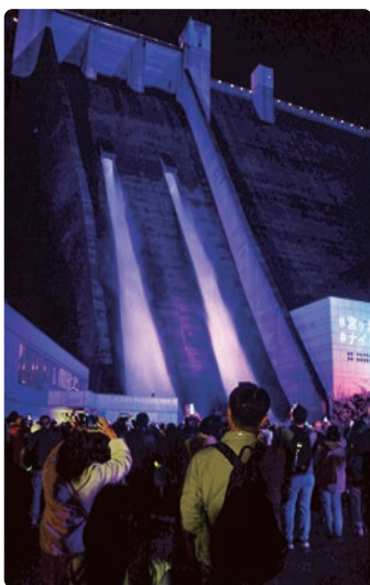
ライトアップ放流