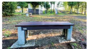
設置されたかまどベンチ

繁茂したイチョウを伐採し、明るい空間を創出したほか、防災機能の強化を図るため、災害時において炊き出し用のかまどとして利用できる「かまどベンチ」を2基設置しました。