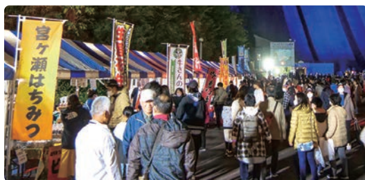
来場者でにぎわう会場

今回、県内をはじめ宮城県や兵庫県など全国から約4,000人の応募があり、当日は、抽選で選ばれた1,200人が参加。色とりどりのライトに彩られた幻想的な放流や、フィナーレに打ち上げられた800発の花火に多くの拍手が沸き起こりました。