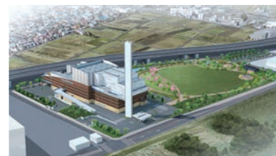
ごみ中間処理施設完成イメージ