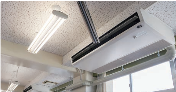
エアコンが設置された図工室

全ての小・中学校において、既にエアコンを整備している普通教室に加え、新たに理科室などの特別教室にエアコンを整備しました。