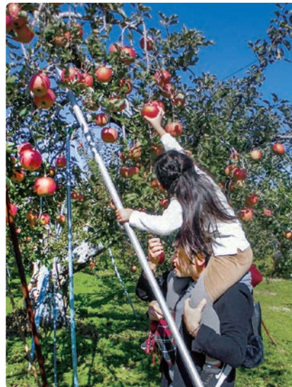
過去のリンゴ狩り体験の様子