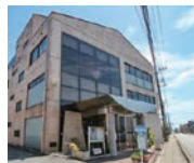
レディースプラザ