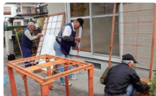
障子の張替え作業

2~3時間程度で完了できることをお手伝いしているボランティア団体です。活動内容は、庭木の手入れ、草むしりや障子・網戸の張替え、窓ガラスの清掃、家具の移動や不用品の処理などです。