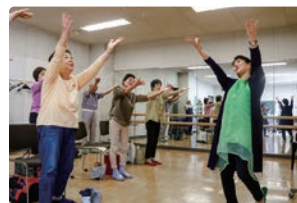
ボイストレーニング教室