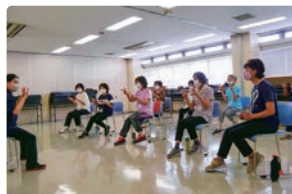
認知機能低下予防教室