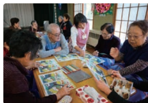
ミニデイサービス