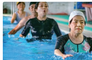
楽しく水中運動教室