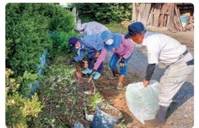
庭掃除のお手伝い

日常のちょっとした困りごとを地域の助け合い・支え合いで解決するボランティア団体です。買い物や電球交換、囲碁などの趣味の相手など、ちょっとしたお困りごとのお手伝いを低価格で行っています。ぜひご利用ください。