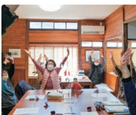
パスタカフェ“ルーシー”で頭と体の体操