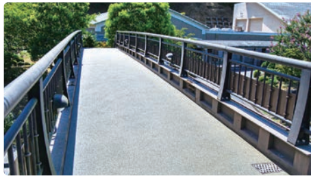
愛川聖苑の第1駐車場と建物の間に架かる歩道橋の舗装工事を実施しました。

今後も引き続き、利用する皆さんの利便性向上と安全確保のため、適切な維持管理に努めてまいります。