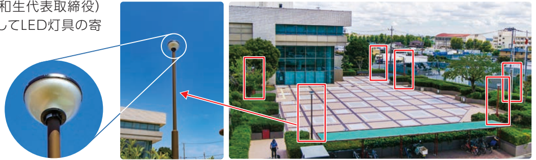
文化会館「かえで広場」に設置されたLED灯具

灯具は文化会館「かえで広場」の床タイル改修工事と併せて設置し、町民の皆様と共に広く活用させていただきます。