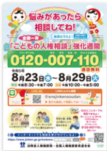
「こどもの人権110番」相談窓口ポスター

相談には、神奈川県人権擁護委員連合会所属の人権擁護委員及び法務局職員が電話で対応します。相談は無料で、秘密は厳守します。ひとりで悩まず相談してください。