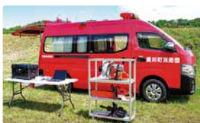
無償貸与された消防車両と資機材

この車両や資機材は災害活動に使用するほか、消防団の普及啓発イベントなどでも使用する予定です。