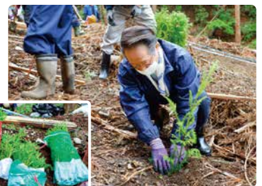
「無花粉スギ」の苗木

苗木を植え付けるとともに、シカによる食害を防ぐために、土壌に自然分解する素材で作られたシェルターを設置しました。