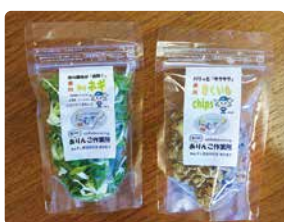
完成した乾燥野菜

この商品は「ありんこ作業所」に通う障がい者の皆さんが細断、乾燥から袋詰めまでの作業を行ったもので、町福祉センターの売店「ふれあいショップ希望」などで販売されています。