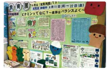
過去の展示の様子

6月4日(日)開催の「健康フェスタあいかわ2023」の健康イベント内でも食育展コーナーを実施しますので、ぜひご来場いただき、食について考えたり、見直したりする機会としてください。