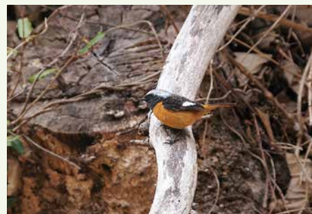
石小屋ダム付近のジョウビタキ

※入館は無料ですが、期間中の土曜・日曜は県立あいかわ公園の駐車場が有料となります。