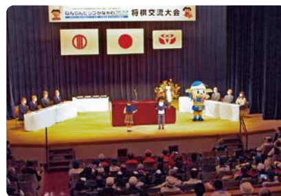
開始式で、町内の小学生による大会開会宣言