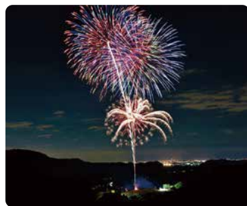
フィナーレの打ち上げ花火