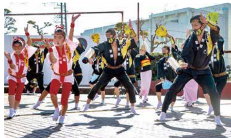
東京高円寺阿波おどり振興協会