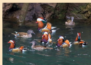
新石小屋橋下流のオシドリ