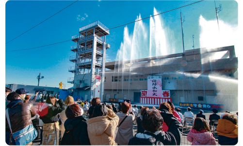
令和4年の一斉放水の様子