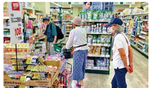
支援事業を利用して買い物をする高齢者の皆さん