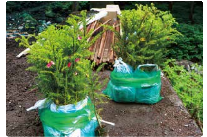
「無花粉スギ」の苗木

「無花粉スギ」は、県が生産している花粉を全く飛散させない品種で、花粉症対策に大きな役割が期待されています。